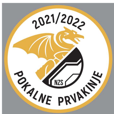
Našitek pokalnih prvakov

Zmagovalna ekipa Pokala Pivovarna Union iz pretekle sezone bo pred pričetkom posamezne sezone prejela našitke za drese, ki se nosijo na sredini na sprednji strani dresa. Našitki se lahko nosijo na vseh dresih, ki so v uporabi v posamezni tekmovalni sezoni.